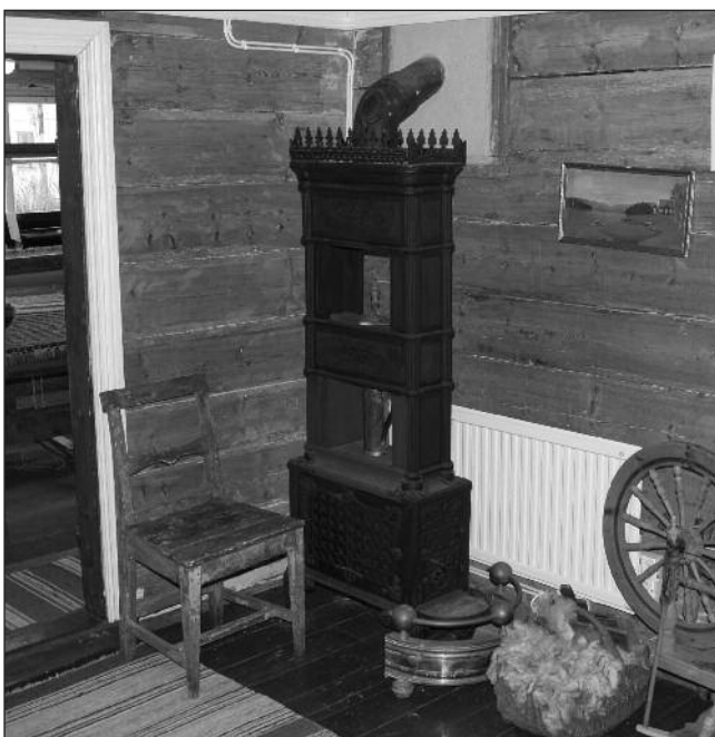
Ovnen var samlingspunktet i stua

Nei, det er ikke vanskelig å tenke seg tilbake til gamle dager og hvordan folk hadde det da – når en ser både fjøs, stue og kjøkken. Til og med utedoen er på plass! Og et lite kammers ved siden av kjøkkenet nærmer seg ferdig. Bryggerhus med bryggerpanne og alt som hørte til klesvasken, vil også bli tatt med. En hel avdeling fra