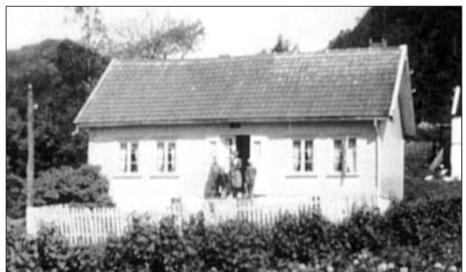
Huset på Daland