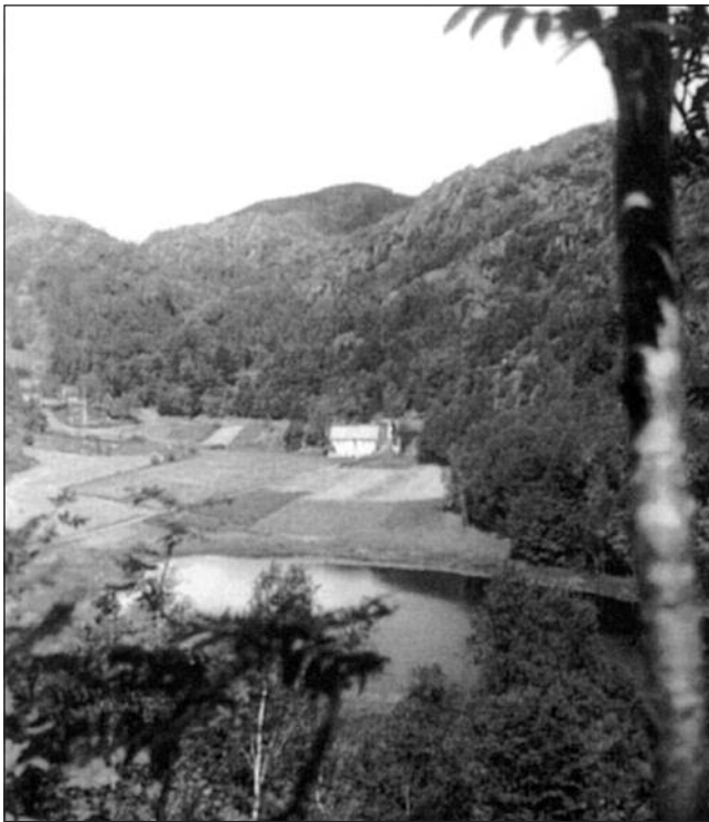
Daland sett fra Leksbøveien